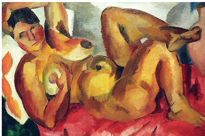
Роберт Фальк «Обнаженная. Крым», 1916 г. | © РИА Новости / Владимир Вяткин

Под горячую руку попал и Эрнст Неизвестный. «Хрущев со всей мощью обрушился на меня, — вспоминал позже скульптор. — Он кричал как резаный, что я проедаю народные деньги». Не понравились генсеку и работы художника Бориса Жутовского, раздражение вызвало полотно Леонида Рабичева.