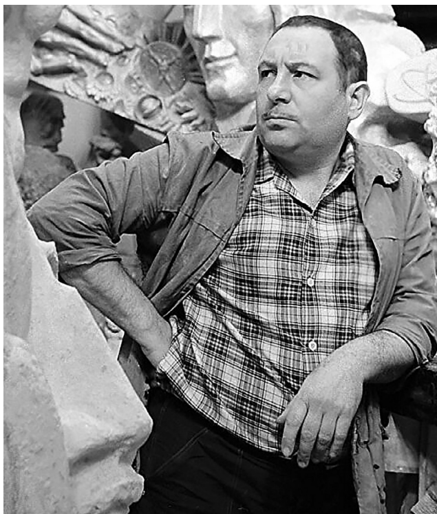
Скульптор Эрнст Неизвестный в мастерской

нием открыли для себя, что авангард в СССР существует и развивается. Якобы сразу же появились фотографии и статьи в западной прессе, даже был снят небольшой фильм. Это вроде бы дошло до Хрущева — и вот на высшем уровне было решено пригласить авангардистов в Манеж.